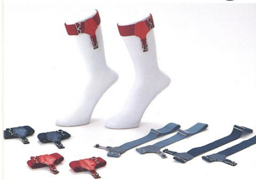
① Men's Elastic Belt